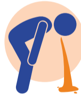
Nausée / vomissements