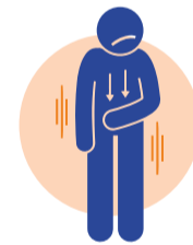
Sentiment de faiblesse