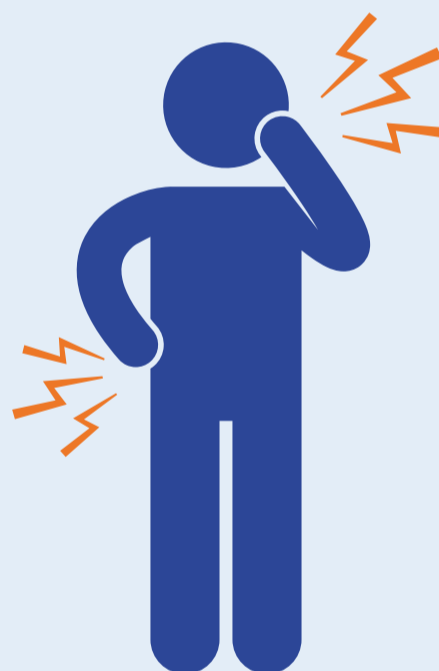
Sakit kepala/ nyeri otot